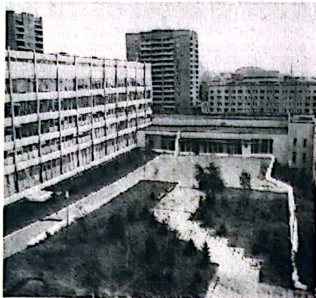
Учебный корпус ИТФ.

На факультете проводится обучение студентов по следующим специальностям: