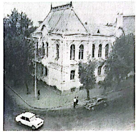
Учебный корпус ТЭФ.

Работа инженера-проектировщика теплотехнологии связана с эксплуатацией, проектированием, монтажом, наладкой и исследованиями котельных, компрес-