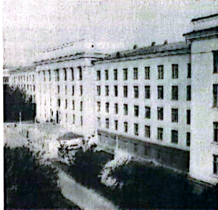
Учебный корпус № 1

Выпускающая кафедра "Инструментальные системы автоматизированного производства" является одной из старейших кафедр факультета (1933 г.). Кафедра имеет учебные лаборатории по резанию металлов и режущим инструментам, оснащенные приборами, персональными ЭВМ, тех-