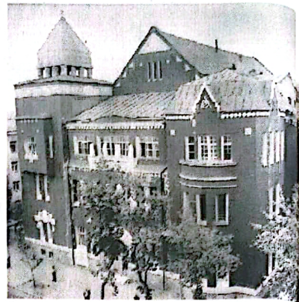
Учебный корпус ХТФ.

Инженер по промышленной экологии - это одна из самых молодых и самых дефицитных